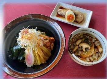
ネギチャーシューつけ麺