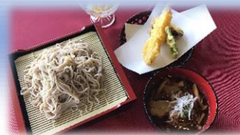
熱々つけ汁そば<天ぷら付き>